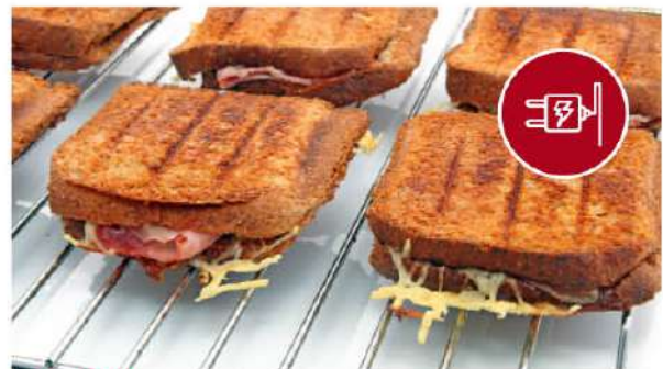
POTENCIA de 2200 Watts.