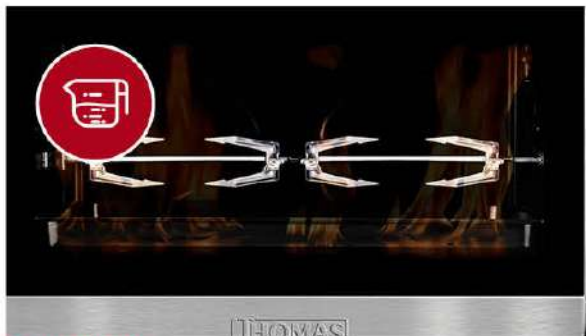
CAPACIDAD para 100 litros.

HOVNO ELÉCTRICO TH-100i. Horno Thomas XL de 100 litros de capacidad especial para abastecer grupos grandes de personas o eventos. Cuenta con 2200 Watts de consumo, luz indicadora de funcionamiento e interior antiadherente.