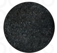
Palma Látex Arenoso