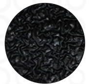
Palma Látex Rugoso