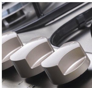
Comandos rotativos con anclaje de seguridad